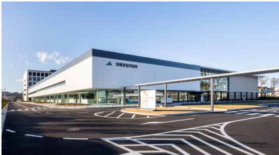
相模原協同病院（新病院）外観